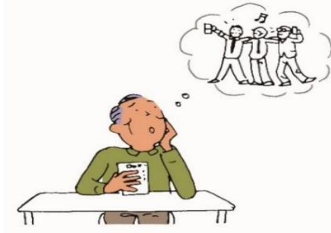
友達との会話についていけない

難聴を放置しておくことコミュニケーションの減少や社会からの孤立、ひいては認知症やうつの要因になるといわれています。