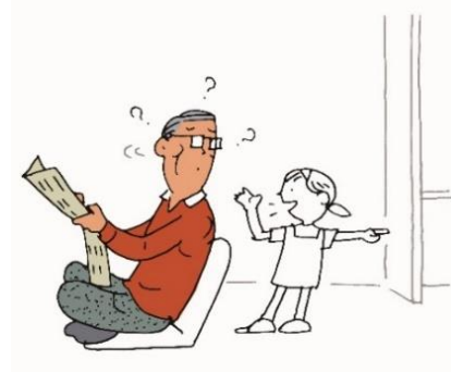
聞こえにくさが原因でコミュニケーションが減少