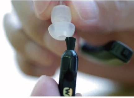
付属の掃除用ブラシを使って音の出口を下に向けてブラッシングします。

イヤモールドや耳せんも1ヶ月に1回は洗浄しましょう。専用のクリーナーのご使用をおすすめしますが、ない場合は、就寝時に補聴器本体からはずして(石鹸を入れた)水やぬるま湯につけておくだけで汚れが落ちやすくなります。チューブの中に入った水は、エアブローを使って吹き飛ばします。