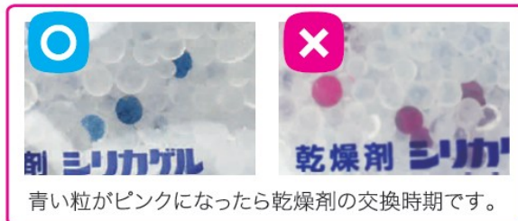
青い粒がピンクになったら乾燥剤の交換時期です。