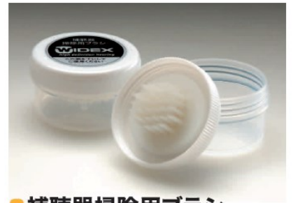
●補聴器掃除用ブラシ